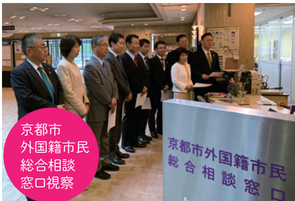
京都市 外国籍市民 総合相談 窓口視察