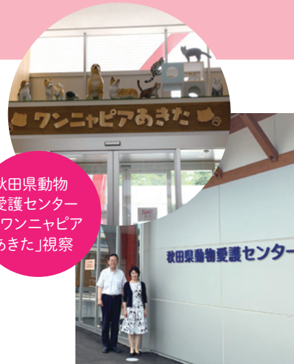
秋田県動物 愛護センター 「ワンニャピア あきた」視察