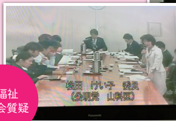
教育福祉 委員会質疑