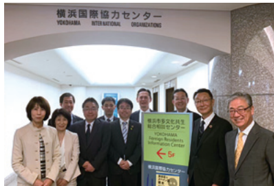
横浜市多文化共生総合相談センター視察