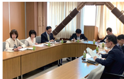
川崎市の多文化共生社会への取り組みについて調査