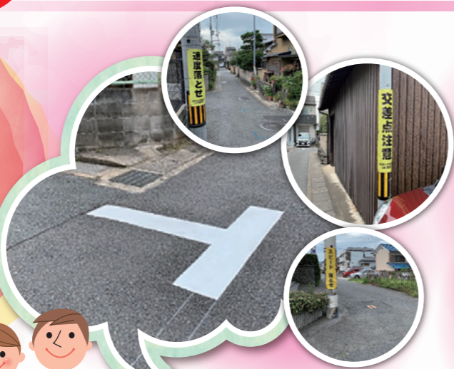
丁字マーク(交差点クロスマーク)・電柱幕の設置(大宅辻脇町)