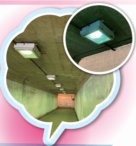
地下道の照明補修(北花山六反田町)