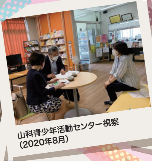
山科青少年活動センター視察 (2020年8月)