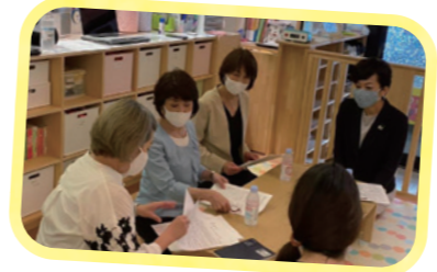
保育現場の現状を聞く