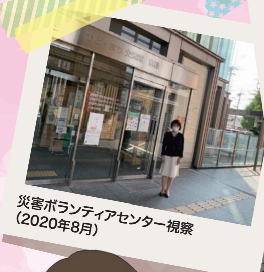
災害ボランティアセンター視察 (2020年8月)