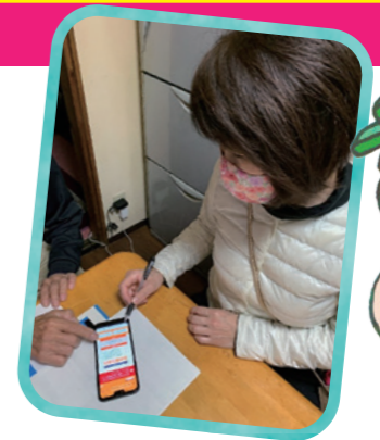
持続化給付金申請の説明