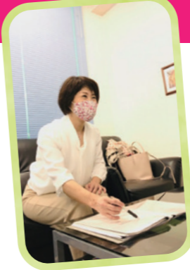
フリーランスで働く女性の相談