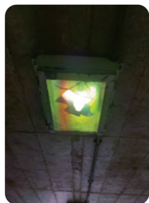
地下道照明灯 整備前