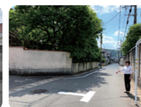
T字マーク路面標示