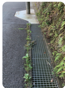
グレーチング整備後