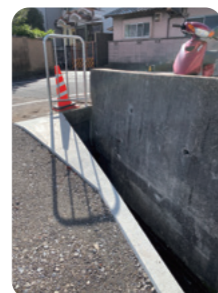
転落防止柵設置及び 変則な急下り坂を防ぐ対策