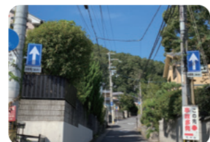
一方通行標識増設及び速度規制表示