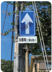
一方通行標識増設