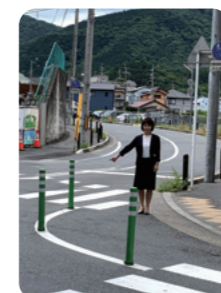
速度抑制のための ラバーポール設置