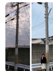
照明灯 設置前/設置後