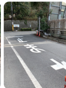
止まれ路面標示の補修