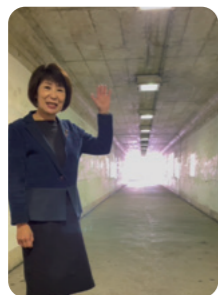
地下道照明灯 整備後