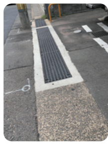
流れ改善 及びグレーチング設置 整備後