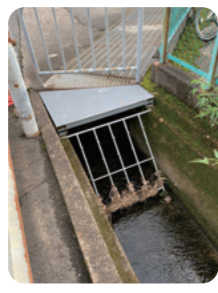
流れ改善 及びグレーチング設置 整備後