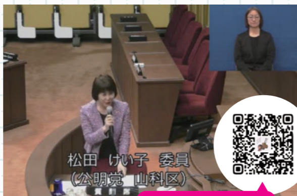
総括質疑の様子はこちらから